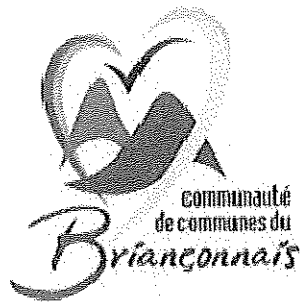
TABLEAU RECAPITULATIF DES MARCHES PUBLICS CONCLUS PENDANT L'EXERCICE 2012