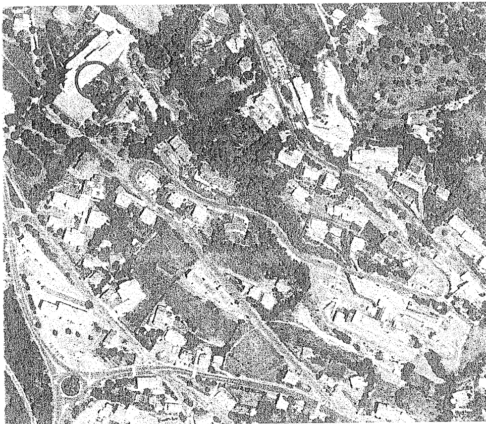
Extrait IGN BD ORTHO